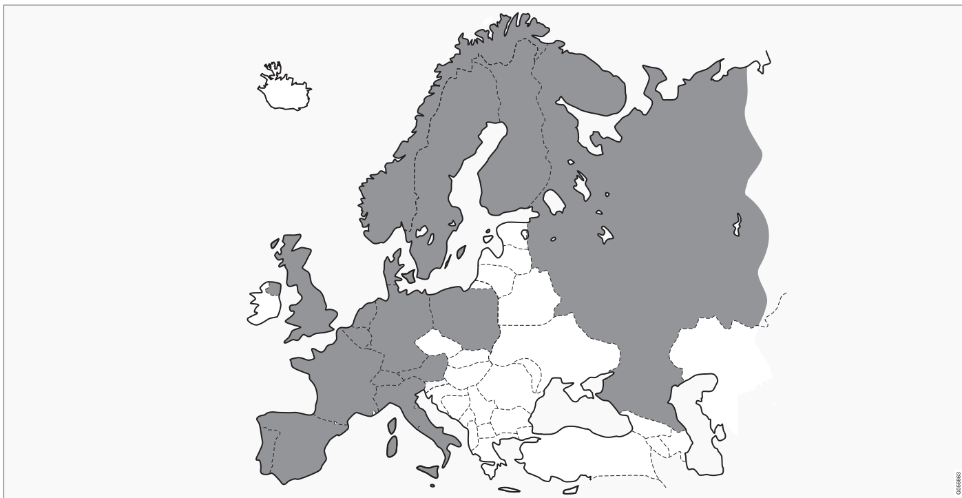
Volvo On Call ist in den grau markierten Gebieten verfügbar.