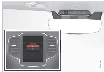
车顶和中央显示屏中的按钮概览