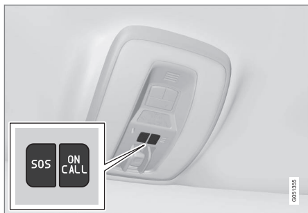
Les boutons Volvo On Call

Volvo On Call est connecté aux systèmes d'airbag et d'alarme du véhicule. Le véhicule est doté d'un module Global System for Mobile Communications (GSM) intégré qui gère la communication entre le véhicule et le centre d'assistance à la clientèle Volvo On Call.